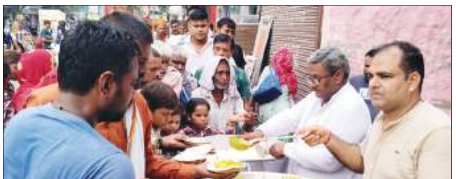
युवतियों की भीड़ भंडारे का प्रसाद ग्रहण करने के लिए जुटी रही। सैकड़ों की संख्या में लोगों ने लाइन लगाकर, जय माता दी के जयकारे के साथ श्रद्धापूर्वक कढ़ी चावल

टीम एक्शन इंडिया/नई दिल्ली नरेला में अमावस्या के अवसर पर मां अन्नपूर्णा भंडारा समिति की ओर से 23वां मासिक भंडारे का आयोजन बड़े ही धूमधाम से किया गया। जिसमें सैकड़ों की संख्या में लोगों ने कढ़ी चावल का प्रसाद श्रद्धापूर्वक व उत्साह के साथ ग्रहण किया। बाहरी दिल्ली के नरेला में अमावस्या के अवसर पर वीरवार को मां अन्नपूर्णा भंडारा समिति द्वारा रेलवे रोड़ स्थित कार्यालय पर विशाल भंडारे का आयोजन किया गया। भंडारे में बड़ी संख्या में लोगों ने पूरी श्रद्धा भाव के साथ प्रसाद ग्रहण किया। इस दौरान काफी संख्या में बच्चों से लेकर युवक