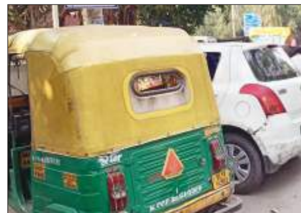
भी बुरा हाल है, लोगों ने सड़क के दोनों साइड पर अपने वाहन पार्क किए हुए हैं, जिससे सड़क तो संकरी होती ही है बल्कि जाम की स्थिति भी बनी रहती है। वहीं

बेतरतीब गाड़ी खड़ी करके इस कदर घेर लिया है, जिससे कि कोई आपातकालीन वाहन का भी निकलना मुश्किल है। वहीं सुभाष पैलेस थाना के पास