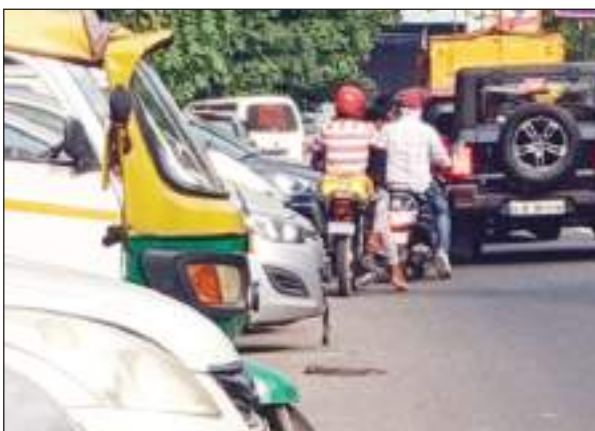
ही पार्किंग में तब्दील कर दिया है। वहीं वार्ड 61-62 स्थित सम्राट इंकलेव से सुभाष पैलेस थाना व शकुरपुर आनंदवास जाने वाले दोनों तरफ की सड़क को लोगों ने

कर रहे हैं त्रीनगर विधानसभा क्षेत्र की, जो कहने में तो पॉश एरिया की लिस्ट में शुमार है, लेकिन यहां पर लोगों ने पार्किंग न होने के चलते मुख्य सड़क को