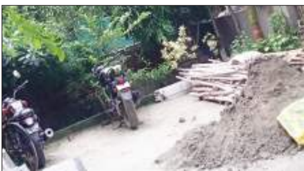
लेकिन अब वहीं पार्क निगम के उद्यान विभाग के लापरवाह भरे रवैय के चलते अतिक्रमण की भेंट चढ़ गया है। कहीं खड़े हैं वाहन, तो कहीं सुख रहें हैं कपड़े: आपको जानकारी के लिए बता दें कि शकुरपुर स्थित

जमा लिया है। उल्लेखनीय है कि शकुरपुर वार्ड-62 के डी-ब्लॉक में स्थानीय लोगों के सैर-सपाटे के लिए लाखों-करोड़ों रूपए खर्च करके निगम का पार्क बनाया गया था और जिसकी बागवानी में भी लाखों रूपए खर्च किए होंगे,