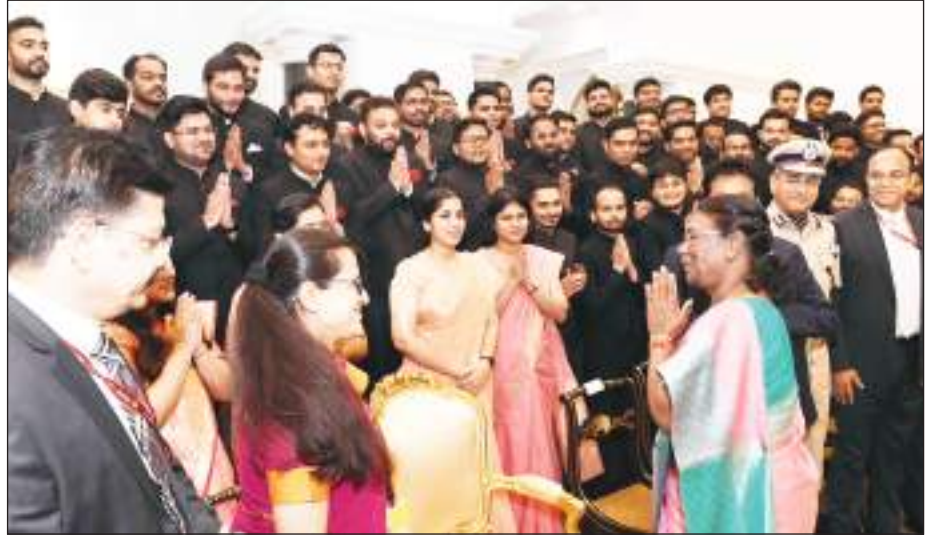
भारतीय रेलवे (2018 बैच) के 255 प्रोबेशनर्स के एक समूह ने गुरुवार को राष्ट्रपति भवन सांस्कृतिक केंद्र में राष्ट्रपति द्रौपदी मुर्मू से मुलाकात की।

आतंकवाद-रोधी बल के रूप में खड़ा किया गया था। इसके पास एक विशेष दस्ता भी है जो वर्तमान में उच्च जोखिम वाले वीवीआईपी को सुरक्षा कवर प्रदान करता है।