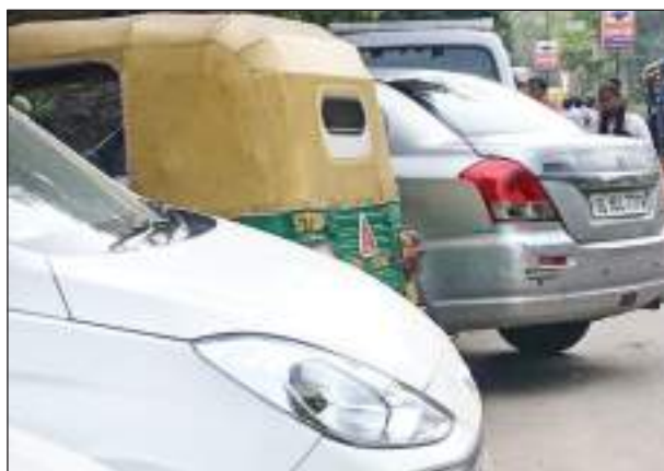
रखी हैं, तो वहीं लोगों ने अपने निजी वाहन खड़ा करके पार्किंग ही बना दी है। अतिक्रमण का शिकार पॉश एरिया: लेकिन यहां पर हम बात

चाहें वह दिल्ली की मुख्य सड़क हो या फिर कॉलोनी की छोटी-छोटी गलियां ही क्यों न हों, सभी जगह का बुरा हाल है, कहीं पर रेहड़ी-पटरी लगाकर सड़क कब्जा