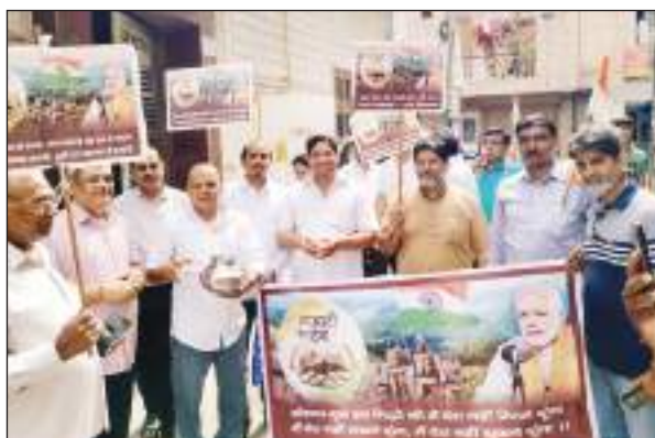
लिए जान देने वाले जाबांज स्वतंत्रता सेनानियों की याद में देश भर में मेरी माटी मेरा देश कार्यक्रम का आयोजन किया जा