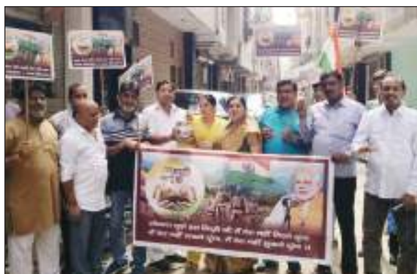
टीम एक्शन इंडिया/नई दिल्ली त्रीनगर विधानसभा क्षेत्र के अंतर्गत आने वाले त्रीनगर वार्ड नंबर-63 में मेरी माटी मेरा देश