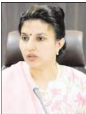
सम्मानित किया जाना है।

जो पूज्य महात्मा गांधी को उनकी जयंती के दिन श्रद्धांजलि होगी। स्वच्छ भारत दिवस-2023 की प्रस्तावना के रूप में स्वच्छता ही सेवा वार्षिक पखवाड़े स्वच्छ भारत मिशन-ग्रामीण व शहरों द्वारा संयुक्त रूप से आयोजित किया जा रहा है। स्वच्छता ही सेवा-2023 का थीम "कचरा मुक्त भारत है" जिसमें साफ-सफाई पर ध्यान दिया जाना है और सफाई मित्रों को