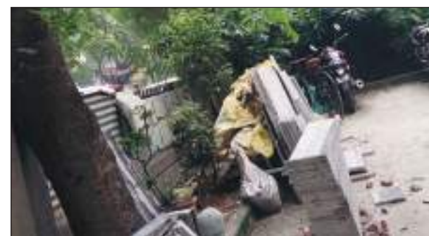
तो वहीं आस-पास के लोग अपने वाहन खड़ा करके मेन रोड से पार्क का दरवाजा ही बंद कर देते हैं। इसके अतिरिक्त आस-पास के लोग कपड़े धोकर पार्क में ही रस्सी बांधकर सुखाते हैं। जिसके चलते और दूसरे लोगों ने

काली माता मंदिर के सामने ब्लॉक डी के पार्क में स्थानीय लोग अपनी निजी संपत्ति समझ कर इस्तेमाल कर रहे हैं, वहीं अगर आस-पास किसी का घर बन रहा हो तो उसका बिल्डिंग मेटेरियल का सारा सामान पार्क में भरा पड़ा हुआ है,