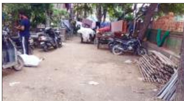
टीम एक्शन इंडिया/नई दिल्ली त्रीनगर विधानसभा क्षेत्र के अंतर्गत आने वाले शकुरपुर के वार्ड-62 स्थित डी ब्लॉक का पार्क निगम की लापरवाही की भेंट चढ़ गया है, जिसके चलते लोगों ने निगम के पार्क पर ही अपना कब्जा

जमा लिया है। उल्लेखनीय है कि शकुरपुर वार्ड-62 के डी-ब्लॉक में स्थानीय लोगों के सैर-सपाटे के लिए लाखों-करोड़ों रूपए खर्च करके निगम का पार्क बनाया गया था और जिसकी बागवानी में भी लाखों रूपए खर्च किए होंगे,