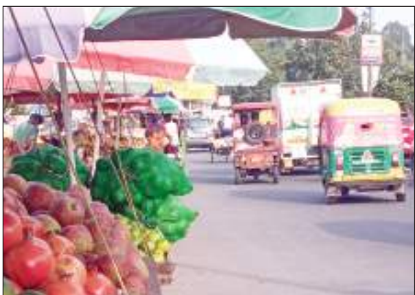
टीम एक्शन इंडिया/नई दिल्ली राजधानी दिल्ली में सड़कों पर अतिक्रमण किसी संक्रमण या वायरल फ्लू के भांति बड़ी ही तेजी के साथ पांव पसार रहा है।

चाहें वह दिल्ली की मुख्य सड़क हो या फिर कॉलोनी की छोटी-छोटी गलियां ही क्यों न हों, सभी जगह का बुरा हाल है, कहीं पर रेहड़ी-पटरी लगाकर सड़क कब्जा